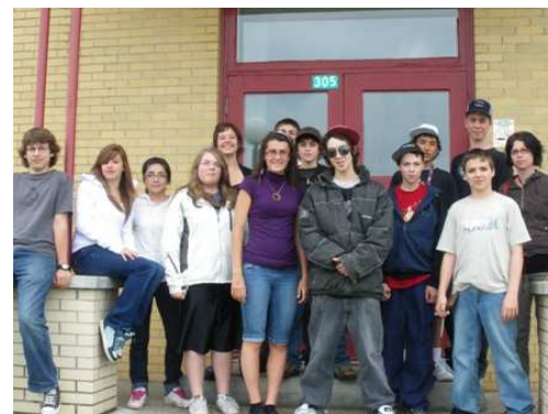
La CJS de Rimouski